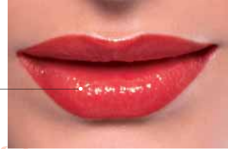
Perfect Color Lipstick Nr. 03