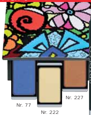
Eye Designer Nr. 93

Originell und knallig: die farbenprächtige Beauty Box mit Magnetboden. Ideal zum Kombinieren und Austauschen von Lidschatten und Rouge.