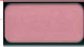
Blusher Nr. 33

Der sanfte Farbton Spring Rose (Nr. 33) des Rouge schenkt Ihrem Teint eine frische und lebendige Ausstrahlung. Tragen Sie ihn mit einem der hochwertigen ARTDECO Echthaarpinsel leicht vom Haaransatz in Richtung Wangen auf.