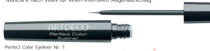
Perfect Color Eyeliner Nr. 1

Betonen Sie Ihre Augen passend zum Lidschatten mit dem Soft Eye Liner waterproof in Cornflower Blue (Nr. 45) oder in Pistachio Green (Nr. 19). Alternativ hierzu gibt es den neuen Perfect Color Eyeliner in klassischem Black (Nr. 1). Verwenden Sie anschließend eine ARTDECO Mascara nach Wahl für einen intensiven Augenaufschlag.